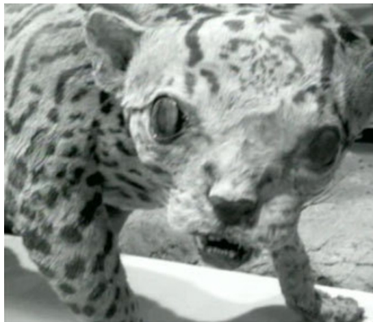
Trisha Donnelly UNTITLED 2005 Video 0:20 Min. s/w, kein Ton / b/w, no sound